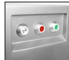
Diseño enfocado en la facilidad de uso.