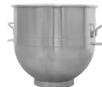
Tazón con una capacidad de 60L y un espesor de 1.25 mm.